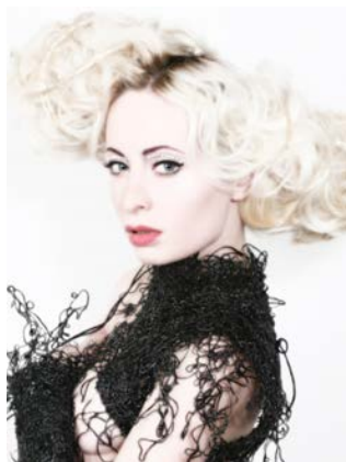
Jérôme Blin www.jerameblin.book.fr