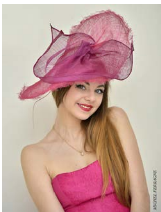
Lady Chapearly www.ladychapearly.fr