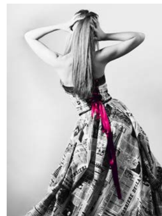
Salas Retouches et Confections www.salas-retouche-confection.fr